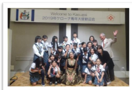
写真：春日井市を来訪したケローナ青年大使の様子（令和元年度）