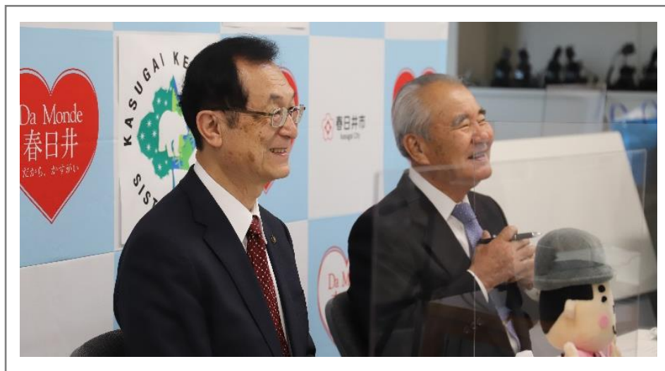
左:伊藤市長 右:松尾会長

新型コロナウイルスの世界的な流行により、今は自由に往来することが叶いませんが、オンラインで 40 周年を祝うメッセージを交換し、春日井とケローナ両市のさらなる発展と友好関係が深まることを願い、両市長が姉妹都市提携確認書にサインをしました。